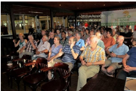
Een volle zaal

Zevenenzeventig leden van Opgewekt Houten investeren in dit zonnedak, profiteren lang van de opbrengsten en dragen bij aan een schoner milieu!