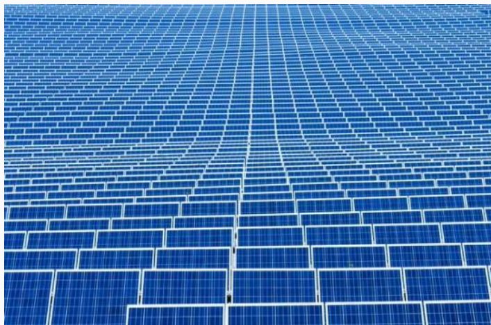
Figuur 3 | Trend: zonnepanelen op andermans dak

En net als Opgewekt Houten zijn velen bezig met het lokaal opwekken van duurzame energie. Dat geeft zicht op een duurzame toekomst!